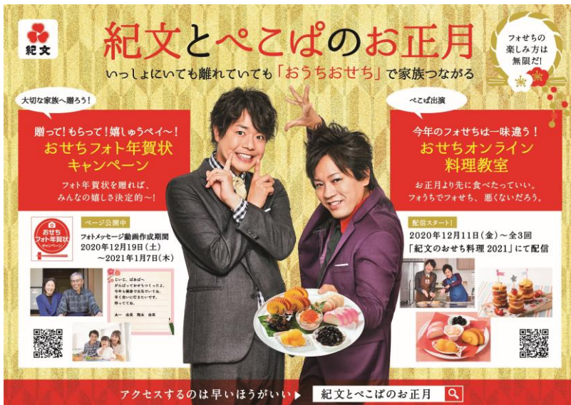
<店頭ポスターイメージ>

そこで、おせち料理作りが初めての方、久々にやってみようかとお考えの方、もちろんいつもやっている方も、みなさまに楽しくご覧いただけるおせち料理作り動画を、12月11日(金)より3週連続で配信します。何を作るかは見てのお楽しみ！