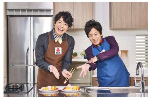
<料理動画イメージ>

◆視聴 URL: www.kibun.co.jp/brand/osechi/cp/ryori/