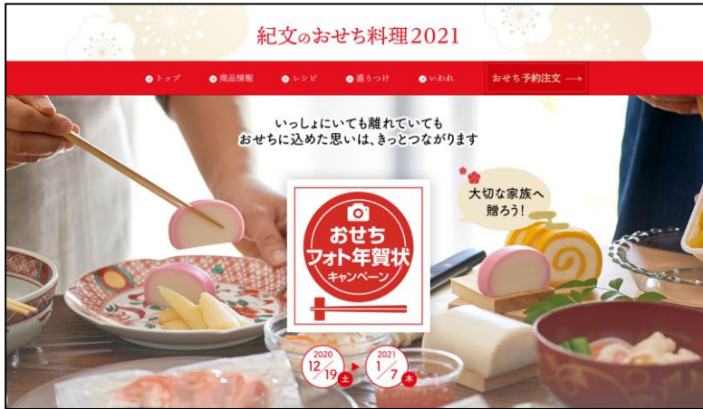
<キャンペーン特設サイト>

7月に行った調査によると、2021年の正月は「家族や親戚と直接集まらない予定」という方が半数以上いることがわかりました。新しい生活様式で迎える初めての正月。そんな中、会えなくても家族のつながりや絆を感じられるよう、写真を活用してオンラインで簡単にフォトメッセージ動画を送ることができる「おせちフォト年賀状」キャンペーンを実施いたします。